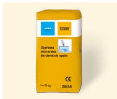
Sisteminis skiedinys SILKA-YTONG