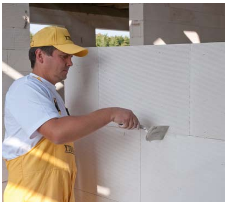
YTONG INTERIO blokeliai – tai tvirta ir lygi siena