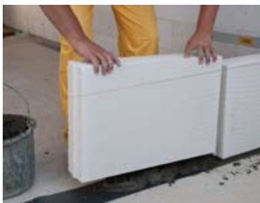
Sekantis blokelių dedamas vertikales siūles paliekant neužpildytas skiediniu - jį pakeičia iškišų ir išėmų sistema.