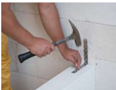
Pertvara su laikančia siena yra jungiamos metalo jungtimis.