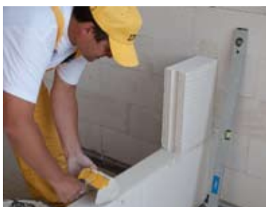
Skiedinį paskirstyti plonomis siūlėmis skirta mentele.