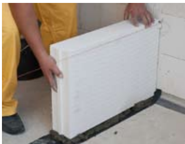
Pirmas blokelių sluoksnis yra dedamas ant tradicinio skiedinio, nepamirštant izoliacijos nuo drėgmės.