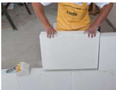
Mūrijant sekantį sluoksnį, reikia nepamiršti apie vertikalių siūlių perkėlimą.