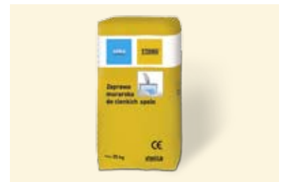
Mišiniai ir tinkai