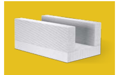
U - formos