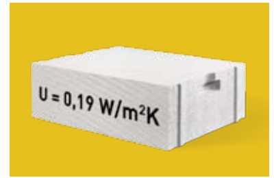
Bloki YTONG Energo