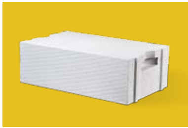
Blokeliai su iškišomis ir išpjovomis ir montažine išėma