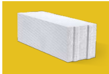
Lygių paviršių blokeliai