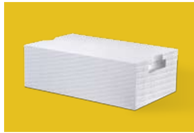
Blokeliai su montažine išpjova