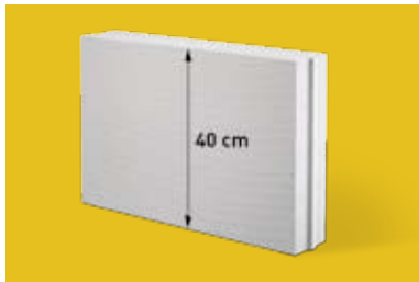
Bloki YONG Inerio